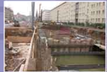
Abb. 9 (oben): Der hohe Grundwasserstand sorgte gelegentlich für wassergefüllte Baugruben.