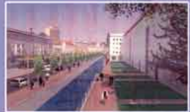
Abb. 8: Eine Planansicht der Jahnallee ab Sommer '06.