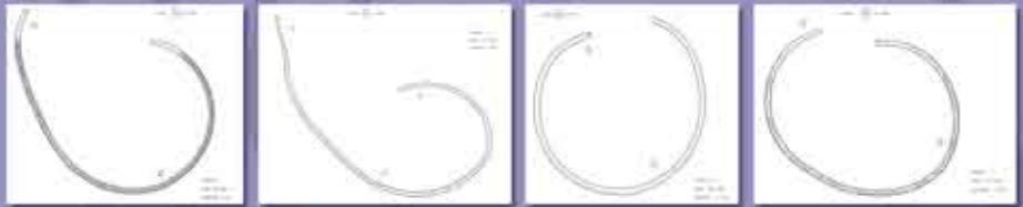
Abb. 14-17: Handzeichnungen (1:1) von vier der sieben im Depot vorgefundenen Halsringe als Bestandteil der Funddokumentation.