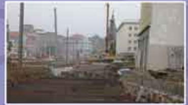
Abb. 6: Die Jahnallee im Sommer '05.