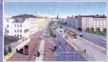
Abb. 11: Die neue Jahnallee im Planmodell.