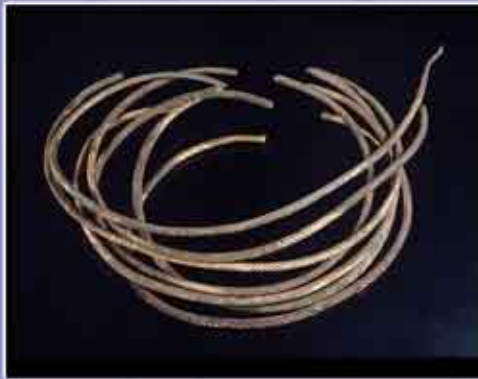
Abb. 1 (Deckblatt) : Die Jahnallee vor dem Umbau aus der Vogelperspektive mit Kennzeichnung des Depotfundortes.

Abb. 2-4 (Deckblatt): Handzeichnungen von 3 Ringen des Ringdepots als Teil der Funddokumentation.