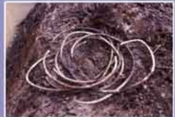
Abb. 13: Der Depotfund bei der Auffindung.