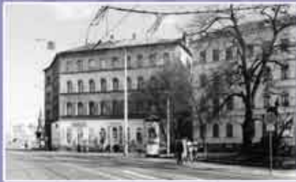
Abb. 7: Die kleine Funkenburg vor dem Abriss.

Die Baustelle wurde seitens des Landesamts für Archäologie vom 27.04.2005 – 10.12.2005 betreut. Die Grabung wurde in der Regel baubegleitend durchgeführt, d.h. Mitarbeiter des Landesamtes für Archäologie beobachteten die Baggerarbeiten und führten dort, wo sich Befunde abzeichneten, punktuelle Grabungen und Dokumentationen durch. Bei befundreichen Abschnitten wurde das dreiköpfige Grabungsteam aufgestockt, so dass bis zu 15 Mitarbeiter tätig waren.