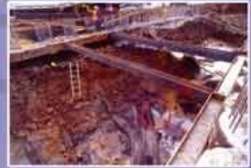
Abb. 12: Neben der umgestürzten Eiche lagen die sieben Halsringe.

Die ineinander verschlungenen Halsringe sind teilweise tordiert, teilweise unverzert und haben die charakteristische goldene bis braune Oberfläche von Bronzeobjekten die aus einem Feuchtbodenmilieu stammen (Moorpatina). Die Enden der durch starkes Aufbiegen unbrauchbar gemachten Stücke zeigen keine Bearbeitungen. Es ist davon auszugehen, dass die Ringe als Bündel bei religiösen Zeremonien ins Wasser geworfen wurden. Vergleichbare Funde sind verschiedentlich aus Mitteleuropa bekannt geworden, zuletzt 1999 aus Großschorlropf bei Kitzen, Lkr. Leipziger Land, wo ebenfalls sieben Ringe in einem Brunnen deponiert wurden.