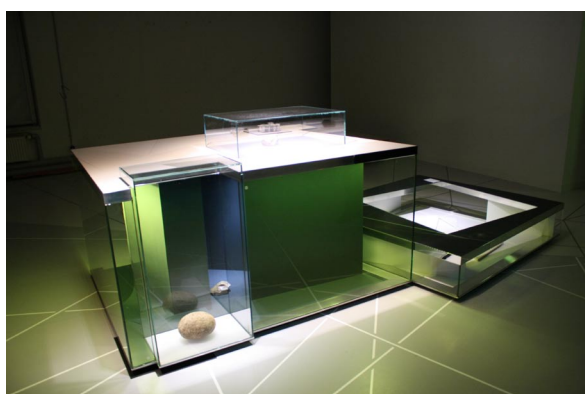
Der Prototyp einer Vitrine im Probeaufbau.