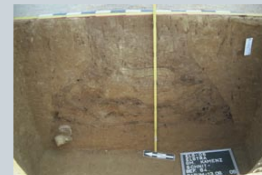
Im Profil sieht man deutlich die trichterförmige Ausbildung der Gruben

Weitere Eintiefungen dienten als „Webgruben“, in die die Kettfäden des stehenden Webstuhls lang herabhängten. Seine Verwendung in dieser Zeit sichern Funde von Webgewichten. Besonders schöne, vollständige Exemplare fanden sich gerade in Elstra. Die genau Ansprache und Interpretation der einzelnen Befunde muss einer detaillierten Auswertung vorbehalten bleiben.