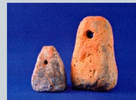
Zwei der vollständig erhaltenen Webgewichte aus Elstra