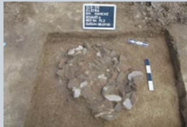
Ein Scherbenpflaster auf dem Boden einer Grube

Die vielen Befunde unterschiedlicher Größe dienten verschiedenen Zwecken. Zunächst wurde hier Material für den Lehmverputz der Gebäude entnommen, die Gruben später oft mit Abfall verfüllt. Daneben konnten in Elstra aber auch Beispiele für Vorratsgruben dokumentiert werden. Diese waren trichterförmig und zum Zeitpunkt der Ausgrabung bereits mit verschiedenen Schichten verfüllt. Solche Gruben sind typisch für metallzeitliche Siedlungen. Sie nutzen die Kühle des Bodens wie eine Art Kellerraum. Befunde dieser Art konnten in der Lausitz bislang nicht so schön beobachtet werden. In anderen Gruben lagen Scherben haufenweise.