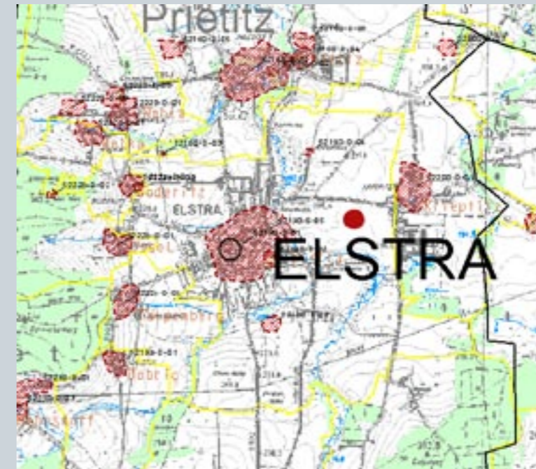
Karte mit bekannten Fundstellen (rot gerastert) in der Umgebung von Elstra. Der rote Punkt markiert den Bereich der Grabung.

Die Oberlausitz ist durch unterschiedliche Naturräume gegliedert. Im Norden prägt das Heide- und Teichgebiet mit sandigen Dünen und feuchten Mooren das Bild. Es wird durch fruchtbare Lössböden des Bautzener Gefildes abgelöst, bis sich ganz im Süden die fast unwirtlichen Höhenzüge des Lausitzer und Zittauer Gebirges erheben. In ostwestlicher Richtung sind es vor allem Flussläufe, die die Landschaft aufschließen: Im Osten fließt die Neiße durch die weite Landschaft, dann durchziehen Spree, Schwarz- und Klosterwasser die sanften Hügel und schließlich begrenzen die Burkauer Berge im Westen die eigentliche Oberlausitz. Genau hier, nicht fern dieser Berge, wurden die Archäologen fündig.