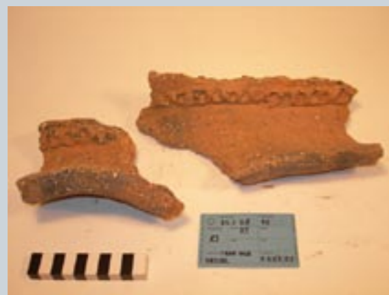
Eine Auswahl charakteristischer Keramikfunde der Ausgrabung in Elstra

Trotzdem sind diese Reste für den Archäologen sehr aufschlussreich, ermöglichen sie ihm doch aufgrund ihrer Form und Verzierungen die Datierung der Fundstelle! In Elstra deutet alles auf eine zweifache Anwesenheit des Menschen hin. Zum einen während der Jungbronzezeit in der Zeit von ca. 1200-1000 v. Chr. Daneben aber auch in der vorrömischen Eisenzeit zwischen 700 und 500 v. Chr. Der Schwerpunkt der Besiedlung scheint jedoch in der früheren Periode gelegen zu haben.