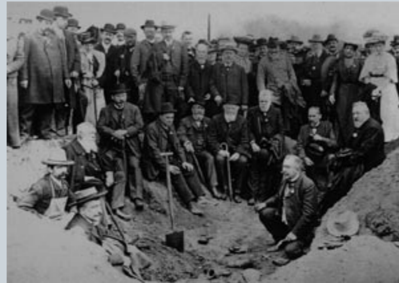
Die frühen Photographien von Ausgrabungen im 19. Jahrhundert dokumentieren neben dem großen öffentlichen Interesse an den Bodenaltertümern auch den Stolz der damaligen Ausgräber

Neben den Gräberfeldern mit ihren reichen Gefäßinventaren wurden Befestigungen untersucht. Diese noch heute obertägig sichtbaren Anlagen gerieten in den Fokus der frühen Archäologen, weil man wissen wollte, ob sie slavischen oder deutschen, illyrischen oder germanischen Ursprungs seien. So wurde aufgrund des einheitlichen Keramikstils eine ganze Kulturepoche unter dem Begriff Lausitzer Kultur zusammengefasst, wobei die ethnische Zuweisung bis heute offen ist.