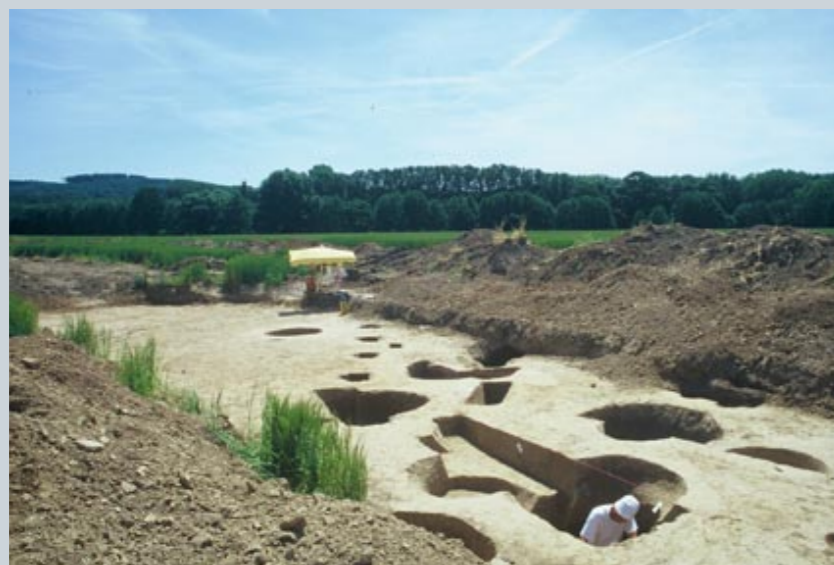
Übersicht über die Grabungsfläche mit bereits teilweise ausgegrabenen Befunden

Bei der Fundstelle handelt es sich um eine nicht befestigte Siedlung. Bislang konnten solche Befunde nur sporadisch ausgegraben werden und waren dann, wie bei Nebelschütz, schlecht erhalten. Da die ehemalige Geländeoberfläche nicht mehr vorhanden war, können oberirdische Bauwerke nur indirekt über Pfostengruben erschlossen werden. Auf der Fläche waren verschiedene Pfostenlöcher und Gruben verstreut. Da die Ausgrabungen nur innerhalb des Baufeldes der Straße erfolgen konnten, waren ganze Hausgrundrisse oder Hofanlagen nicht zu erschließen. Pfostenreihen deuten jedoch auf ehemals vorhandene Ständerbauten hin.